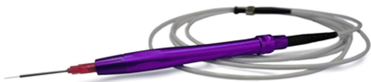
Conducteur de Fibre et Embouts opératoires